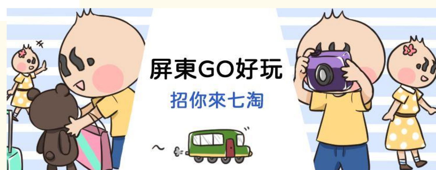
粉絲專業經營Banner設計