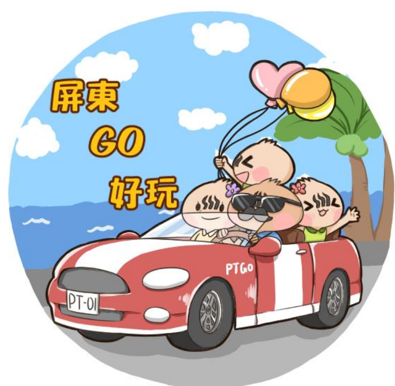
文創商品設計-吸水杯墊