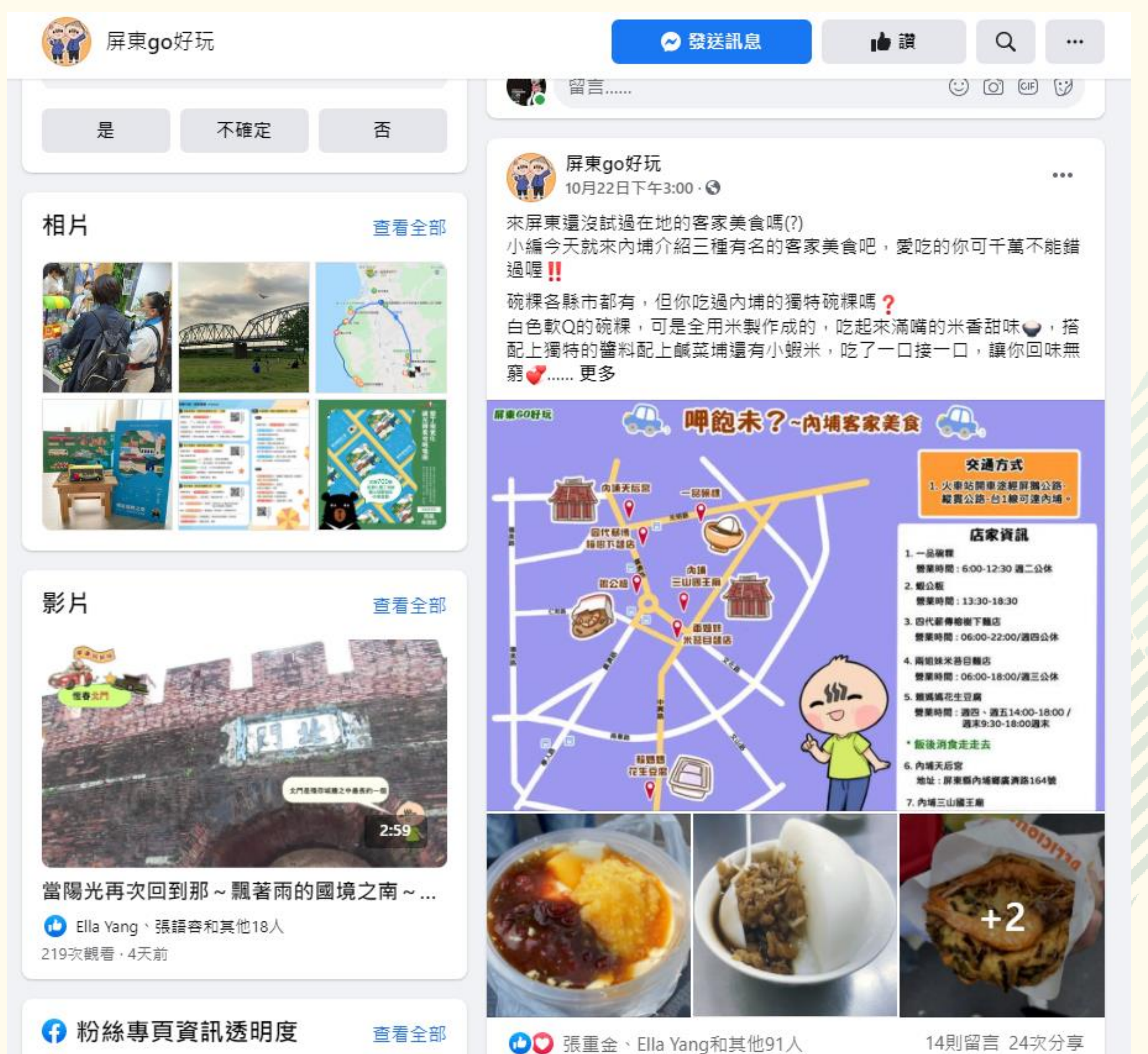
屏東GO好玩粉絲專業經營